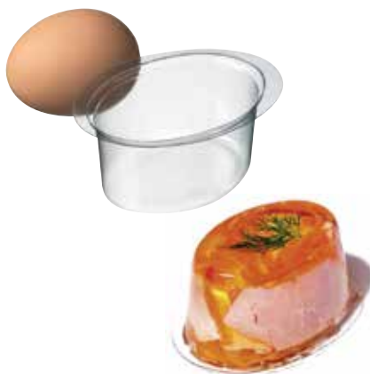
MOULES POUR ŒUF EN GELÉE Polystyrène cristal.