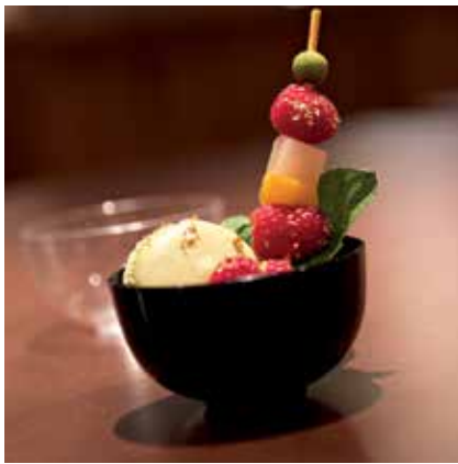
SALADIER 12 CL

BOWL 12 CL Available in : Crystal or black.