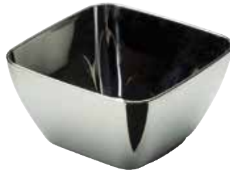
VERRINE CARRÉE ARGENT SILVER SQUARE