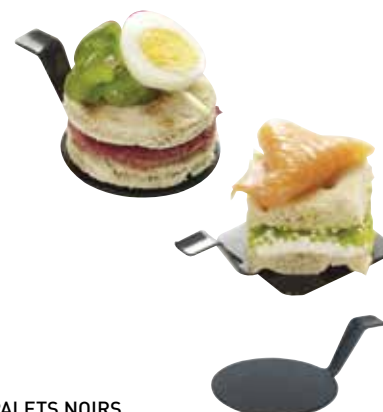
PALETS NOIRS BLACK PUCKS