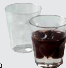
MINI OCTO En polystyrène injecté