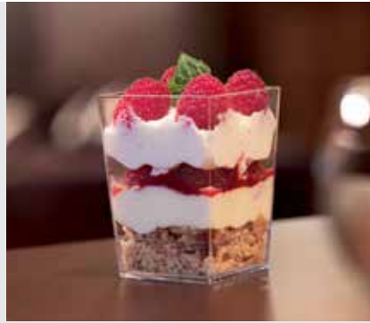
CARRÉ HERMÈS HERMES SQUARE