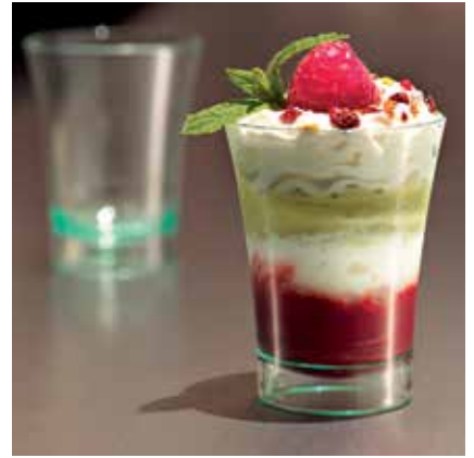
RONDO 5 CL RONDO 5 CL Available in : crystal or sea green.