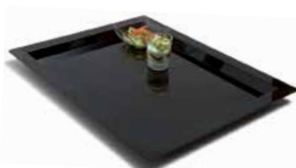
PLATEAU À VERRINES En PS. Noir.