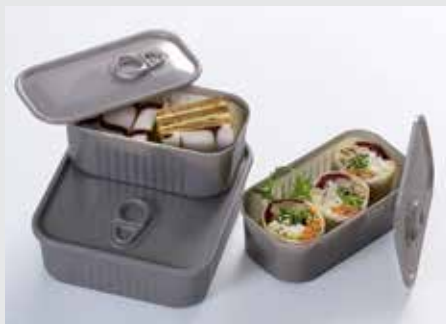
TINBOX En PS.