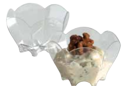
MINI TULIP MINI TULIP