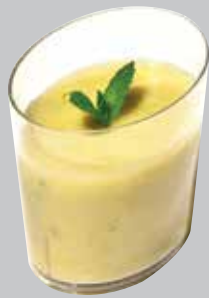
VERRINE OVALE OVAL VERRINE