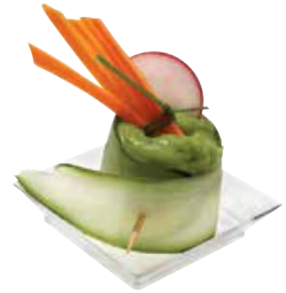
MINI CARRÉ MINI SQUARE