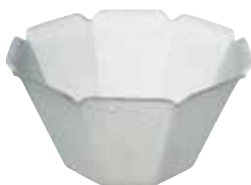
COUPES "ESMÉRALDA" En PS.