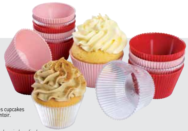
CUPCAKES Pour la valorisation des cupcakes en vitrine et sur présentoir.

CUPCAKES To enhance your cupcake window display.