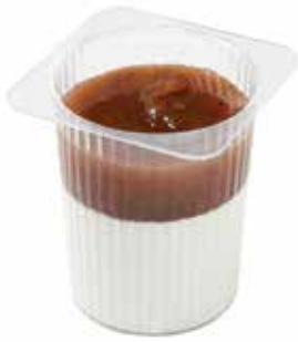
P'TIT SUISSÉ 6 CL "P'TIT SUISSÉ" 6 CL.