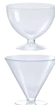
COUPE DESSERT DESSERT CUP