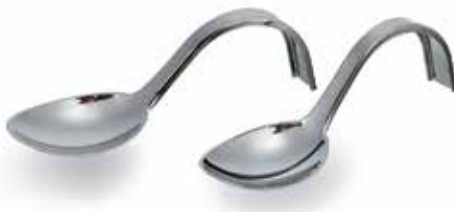
CUILLÈRE RECOURBÉE MÉTALLISÉE CURVED SPOON, METALLIC EFFECT