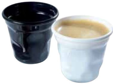
Gobelets Espresso 6 cl En PS.