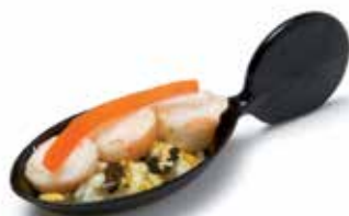
CUILLÈRE PAPILLON BUTTERFLY SPOON Available in : white or black.