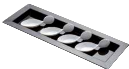
PLATEAU SAÏGON En PS. Noir.