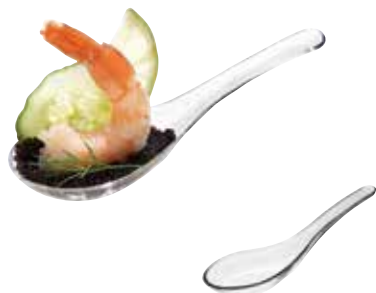
CUILLÈRE ASIE ASIAN SPOON