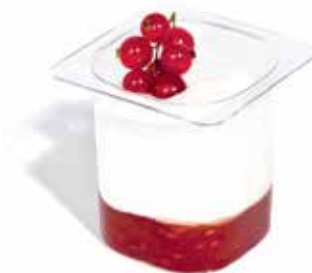
POT YAOURT YOGURT JAR