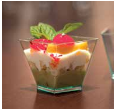
ÇA BALANCE Coloris vert d'eau ÇA BALANCE Sea green