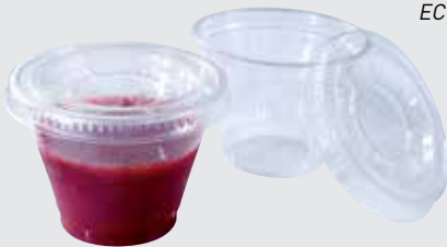
POT ÉVASÉ Couvercle et pot en PET WIDE MOUTH POT PET lid and pot