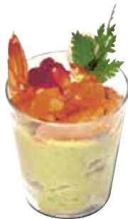
MINI VERRE 5 CL MINI GLASS 5 CL