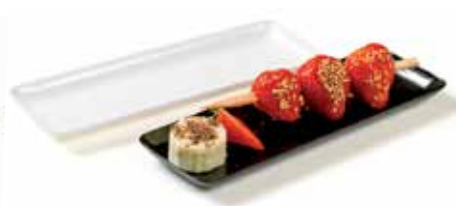
PLAT RECTANGULAIRE RECTANGULAR TRAY