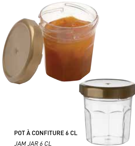
POT À CONFITURE 6 CL JAM JAR 6 CL