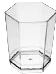
VERRE HEXAGONAL HEXAGONAL GLASS