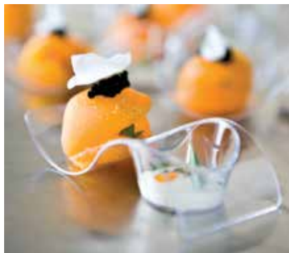
MINI-PLAT WAVE WAVE MINI-DICH