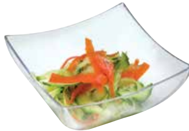
CARRÉ PARAPLUIE 10 CL UMBRELLA SQUARE 10 CL