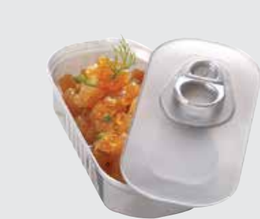
BOÎTE À SARDINES GRISE En PS.