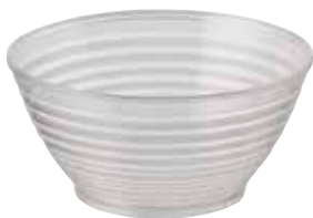
MINI BOL ASIE ASIA MINI BOWL