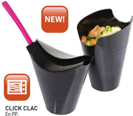
CLICK CLAC En PP.