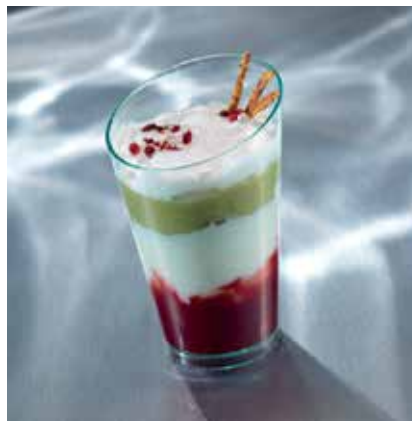
ALTO 7 CL ALTO 7 CL