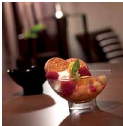
BOL SHANGAÏ 30 CL

SHANGAÏ BOWL 30 CL Available in : black or translucent.