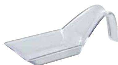
CUILLÈRE SHANGAÏ SHANGAÏ SPOON