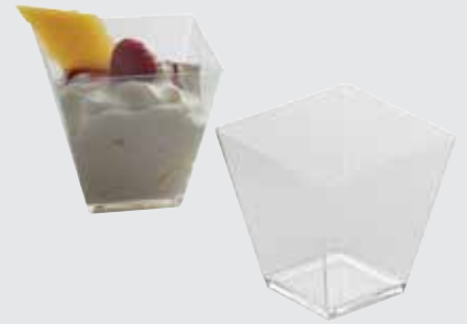
MINI QUADRA MINI QUADRA