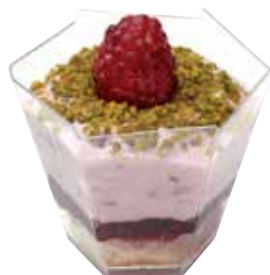
GARDENIA 9 CL GARDENIA 9 CL